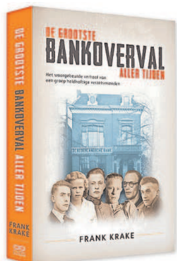
Boekomslag De grootste bankoverval aller tijden.