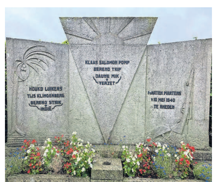
Het oorlogsmonument van Nieuw-Buinen.

Toch is er bijna tachtig jaar na dato geen enkele reden om Douwe Mik niet te eren voor zijn rol in het verzet. Bij het massagraf in de bossen bij Wöbbelin of dichterbij huis bij het oorlogsmonument in Nieuw-Buinen. Misschien in de toekomst bij een groter gedenkteken ter herinnering aan de dadendrang en opoffering van een kruidenierszoon uit Nieuw-Buinen.