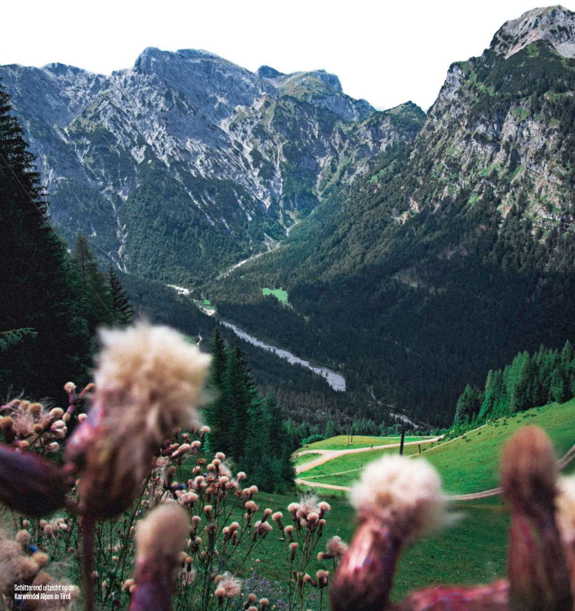
Schitterend uitzicht op de Karwendel Alpen in Tirol