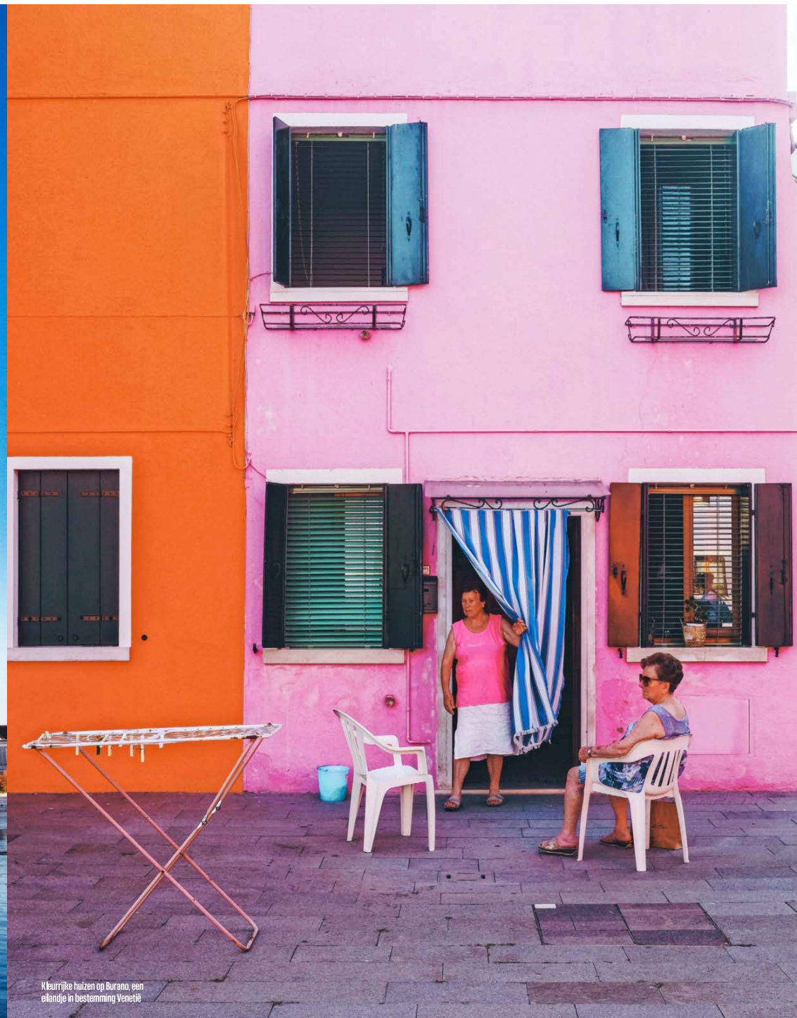
Kleurrijke huizen op Durano, een eilandje in bestemming Venetië